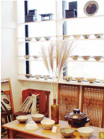
1.2.今秋10月にオープン。独自の視線でセレクトしたアイテムが並ぶ「la kagu(ラカグ)」 3.手土産にぴったりな「ACHO Kagurazaka」のプリン 4.季節のフルーツが楽しめる「スタジオオーネ フルティフィカール」 5.「神楽坂 暮らす。」は2週間ごとに企画展を開催