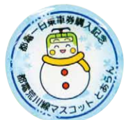
記念ピンバッジ。季節によって絵柄が変わります

▶期間 無くなり次第終了 ▶場所 荒川電車営業所、王子駅前定期券発売所、大塚駅前定期券発売所