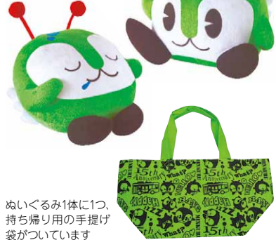
ぬいぐるみ1体に1つ、持ち帰り用の手提げ袋がついています

みんなのぬいぐるみ(縦約25cm×横約30cm×奥行約20cm。1体3000円)は今回で販売終了