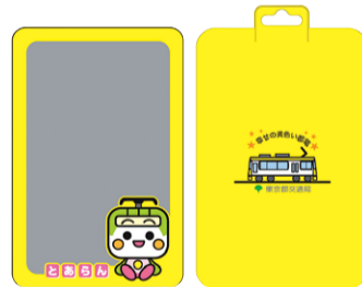
「とあらんIC乗車券ケース」。表面には半立体のとあらんが、裏面には「幸せの黄色い都電」8800形が描かれています