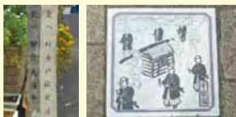
左▲日光・奥州街道と水戸・佐倉街道を案内する道標。右▲宿場町通りの地面には大名行列のタイルがある。