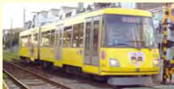
▲限定ヘッドマークを取り付けて運行する東急世田谷線。