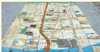
▲東京芸術センター前の広場は以前の千住宿の間屋・貴目改所だった場所。千住宿の案内図が表示。

今回散策する北千住周辺は、「千住宿」と呼ばれ江戸時代に整備された日光街道と奥州街道、水戸街道、佐倉街道の初宿の宿場町として栄えた歴史のあるエリア。旧日光街道だった現在の宿場町通り、本町センター通り、旧やっちゃ場通り沿いには千住宿の名残ある史跡や建物を多く見ることができる。銭湯や老舗の店舗など昔ながらの下町雰囲気満載の北千住。最近では駅前の再開発、大学誘致も行われ、新しいショップも続々オープンしてより一層活気ある街になっている。