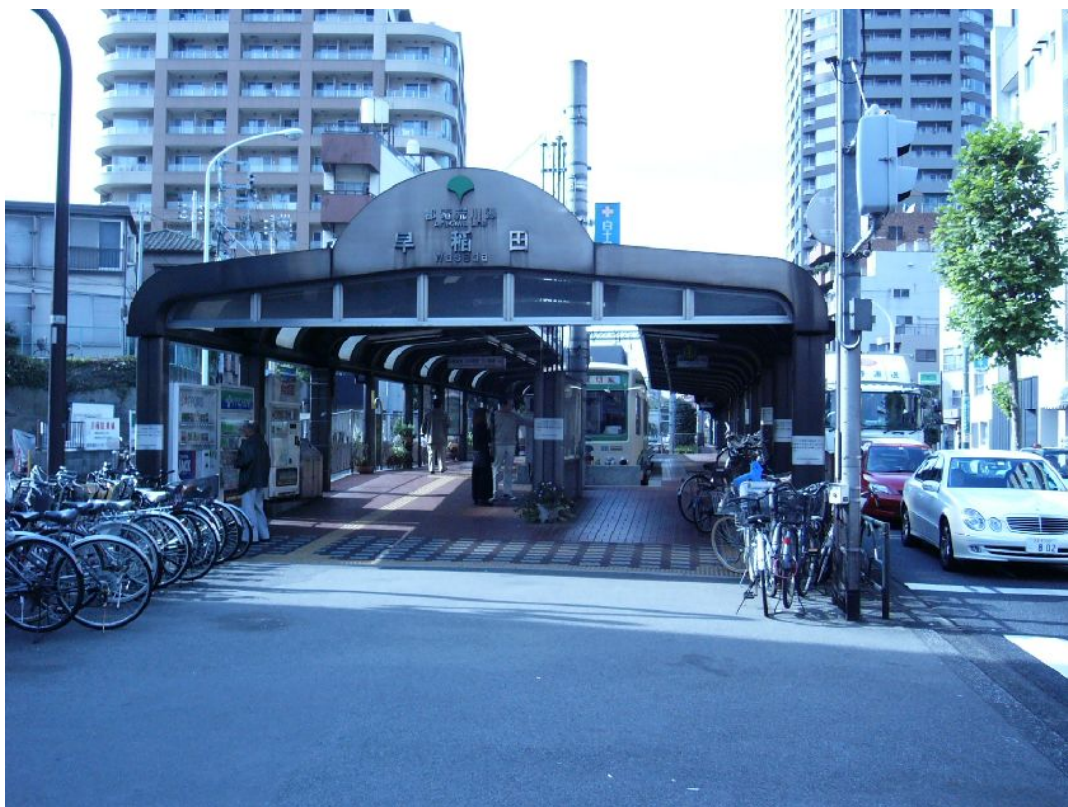
（都電荒川線早稲田停留場）