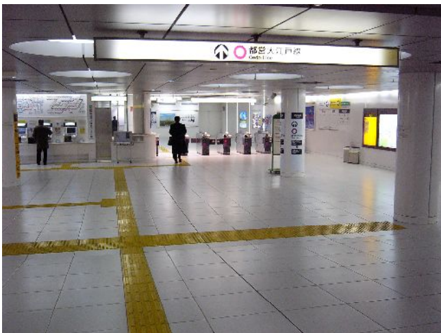
(都営大江戸線汐留駅コンコース)