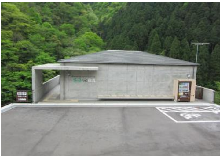
エコっと白丸の外観

( https://www.kotsu.metro.tokyo.jp/other/hatsuden/saienekan_calendar/ ) をご確認ください。