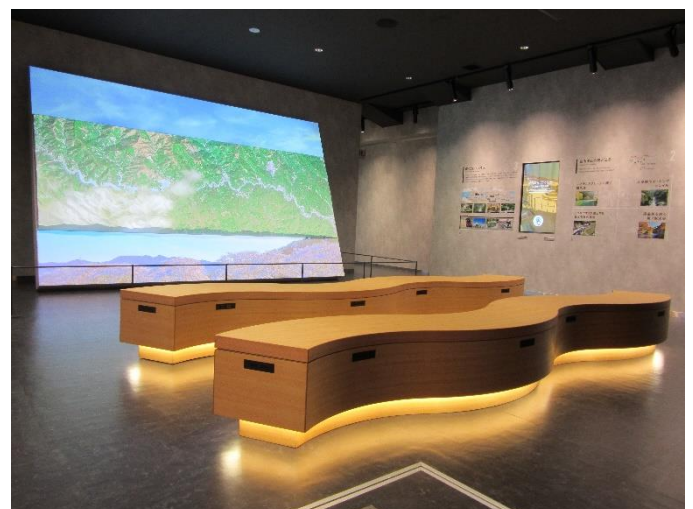
ジオラマシアター