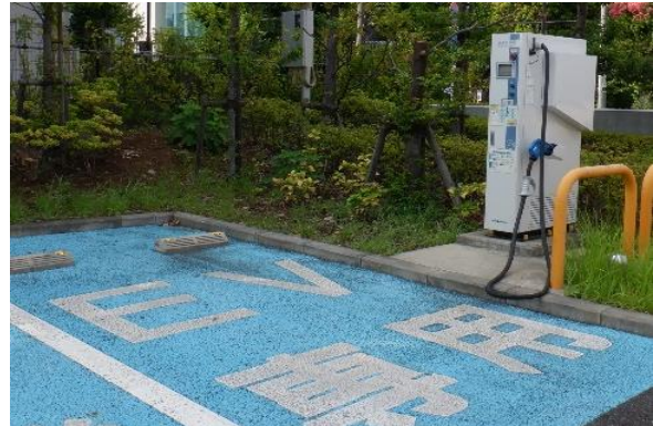
EV用急速充電器（参考）