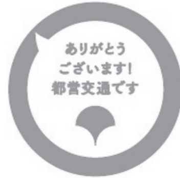
【サービス推進強化月間用ワッペン】

実施に当たっては、お客様に強化月間の周知をするため、営業所や駅務区設置駅等に強化月間の「のぼり」を掲出するとともに、サービスの実践を一層進めるため、平成12年度からは胸リボン、平成14年度からはワッペンを全職員が着用している。