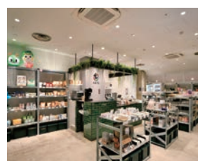
▲沿線セレクトショップ「とえいろ」（市ヶ谷駅）