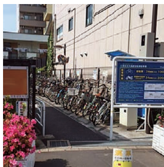
▲駐輪場(大島駅エレベーター横)