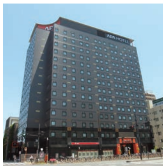
▲宿泊施設(巣鴨自動車営業所横)