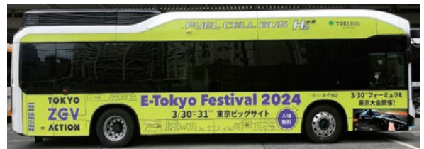
▲ラッピングバス(FCバス)

車内のポスターやステッカー、駅ばりポスターなどの一般的な媒体のほか、ラッピングバスや広告付きバス停留所、車内ビジョン、駅構内デジタルサイネージなど注目度と訴求効果の高い媒体など、様々な広告を展開しています。