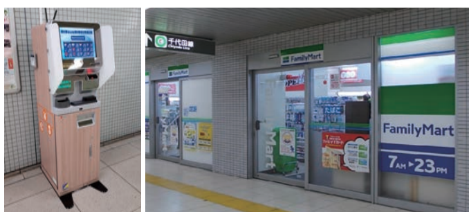
▲外貨両替機(上野御徒町駅) ▲コンビニエンスストア（小川町駅）