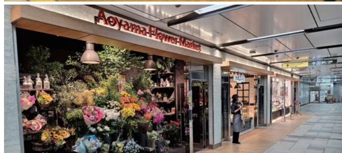
▲駅構内店舗（神保町駅）