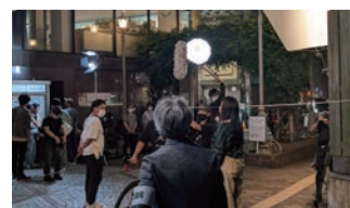
▲テレビドラマ撮影風景