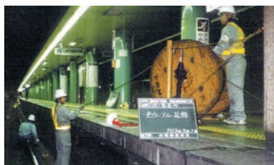
▲光ファイバー工事

さらに、令和5年4月から大江戸線都庁前駅構内において携帯電話5Gサービスを提供しています。