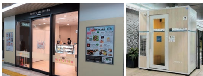
▲期間限定ショップ「TOEI'S SELECTION」(本八幡駅) ▲ワークブース（日比谷駅）