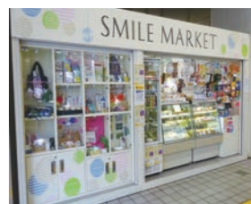
▲障害者が働く店舗（高島平駅）