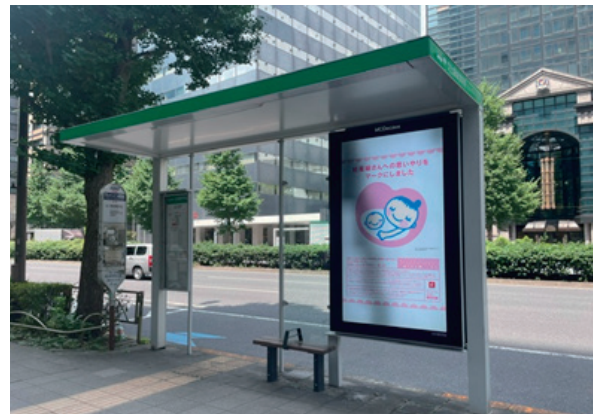
▲広告付きバス停留所