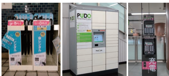
▲傘シェアリングサービスレンタルスポット(高島平駅) ▲宅配受取ロッカー（日暮里駅） ▲モバイルバッテリーレンタルスタンド(神保町駅)