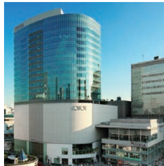
▲有楽町駅前ビル(イトシア)