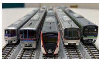
▲ロイヤリティ商品

玩具などの商品化や、駅構内などでの映画やテレビドラマ、雑誌等の撮影を許諾し、都営交通のPRを行うとともに許諾料を得ています。