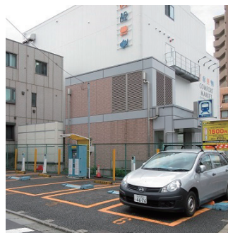
▲駐車場(中延駅A4出入口横)