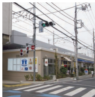
▲志村三丁目駅付近高架下