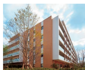
▲保育所等を併設したサービス付き高齢者向け住宅（用賀職員寮跡地）

駅構内営業では、地元区との連携により、障害のある方が働く店舗を4店舗設置し、障害のある方の雇用機会の拡大を支援しています。また、沿線地域の活性化の取組として、都営交通沿線にある店舗等で販売している食品・飲料・雑貨や沿線企業とのコラボ商品を取り揃えた沿線セレクトショップ「とえいろ」を令和6年5月、新宿線市ヶ谷駅構内にオープンしました。