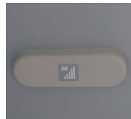
▲5G用携帯電話アンテナ(都庁前駅)