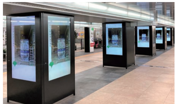
▲駅構内デジタルサイネージ(日比谷駅)