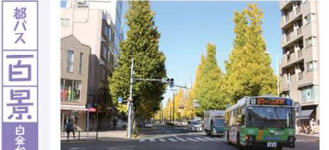
2022 秋発行「紅葉狩り号」より → 新橋駅のりばより 橋86系統で「白金台五丁目」バス下車