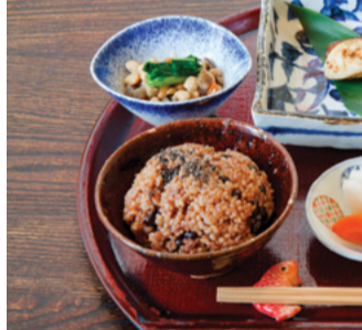
Tokyo Pixel 3-C

近年，前陸續開設多家時尚咖啡廳和時裝店，並成為話題人氣區域。以復古風的像素畫為主題，主要販售雜貨和服裝，匯集了眾多極富藝術性商品的Tokyo Pixel也是人氣商店之一。同時還有畫廊，每週都有時尚藝術家的展覽，值得觀賞，悠閒地在這裡度過美好時光。