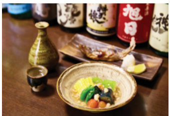
地酒屋 Motto 2-A

大塚站周邊，因為有許多傳統居酒屋而聞名。這些店內匯集了日本各地的在地酒，並提供使用從全國的契約小農家和漁夫等處收購的時令食材精心製作的下酒小吃。以純米為主的在地酒，可以試飲一杯(60ml 300日圓起)，可與朋友試飲各種不同的在地酒，分享感想!