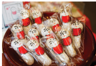
巢鴨 樂大 2-A