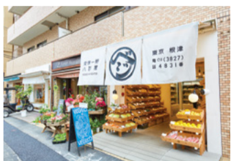
Vegeo Vegeco 根津 2-B

網上銷售新鮮蔬菜的Vegeo Vegeco 路面店。以將生產者的用心和想法直接傳達給消費者作為口號而開設。約8坪的店內擺放著五顏六色的蔬菜水果，就像寶石箱一樣。現場製作的美味冰沙非常好喝。