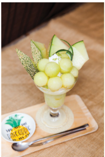
Fruits Sugi 2-A

位於大塚北口商店街的小小水果店。該店的甜點百匯如同花束般，是值得拍照的甜品。「JA熊本優質美味哈密瓜百匯」(1,400日圓)，是使用了整整1/2個美味哈密瓜製成的百匯，這種哈密瓜是JA熊本產量不到1成的稀有品種。因為沒有加糖淇淋等，糖度17度以上的果實本身甜度令人驚訝。