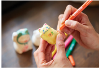
咖啡廳 貓衛門 2-B

在谷根千附近有很多能遇到貓的小巷。貓衛門是招財貓專賣店所經營的，招財貓谷中堂系列咖啡廳。建築使用了90年以上的古民房。在素燒坯塗上底漆的招財貓上，用筆自由上色的彩繪體驗很受歡迎。參加費為1,620日圓，包含茶和以貓為主題的甜點。