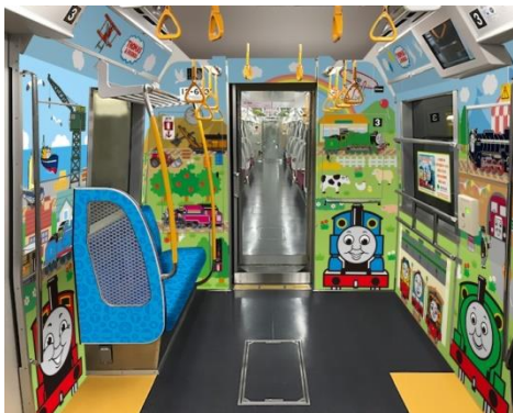
차 내부 장식(이미지)