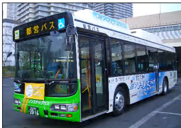
非接触給電ハイブリッドバス外観図