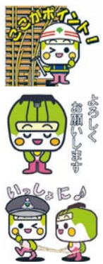
かわいくて使いやすいスタンプです