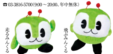
走るみんくる 飛ぶみんくる