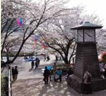
飛鳥山停留場 徒歩1分

東京を代表する桜の名所・飛鳥山のお花見は歴史が古く始まりは江戸時代。徳川八代将軍吉宗が「享保の改革」の一環として整備・解放し、当時桜の名所で禁止されていた「酒宴」や「仮装」が容認され多くの江戸っ子が集まった。