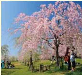
熊野前停留場 徒歩8分

1993年に開園した荒川区にある都立公園。園内にはベニシダレ、センダイシダレなど約220本のシダレザクラが咲き誇る。4月7日には「シダレザクラ祭り」が開催され、草花即売会・模擬店出店など楽しいイベントが開催される。