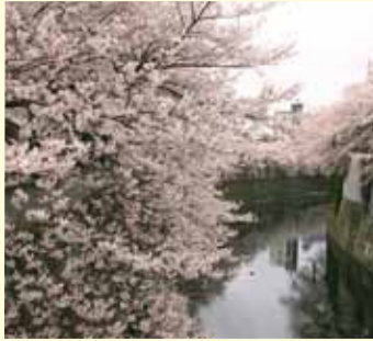
早稲田停留場 徒歩すぐ

春に川面に桜色に染まる神田川の桜は、1982年、洪水対策の改修整備が行われた時、明治時代からの対岸の桜の名所を復活させようと東京都・豊島区・新宿区・文京区が合同で、区制施行50周年を記念に植栽されたもの。