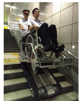
階段昇降車の利用状況