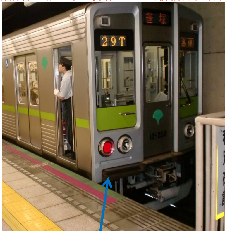
新宿線九段下駅5番線ホーム（新宿方面行）