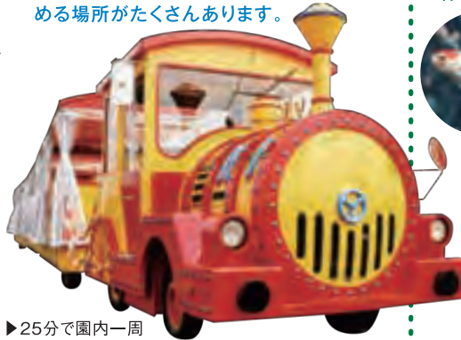
▶25分で園内一周 パークトレイン

広々とした園内には、芝生広場ゾーン、夕風の広場ゾーンの他に、水族園、鳥類園、人工渚が隣接し、一日ゆったりと楽しめる場所がたくさんあります。