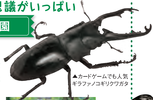
▲カードゲームでも人気 キラファンコギリクワガタ

昆虫、魚類、爬虫類、両生類、哺乳類など、約300種を飼育する足立区生物園。「海の生きものタッチプール」など、夏休みの体験型イベントも各種あります。