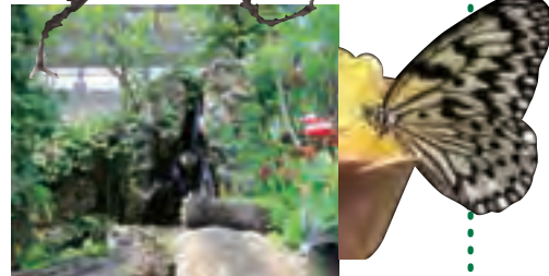
▲オオゴマダラ、クロアゲハなど、何種ものチョウが舞い飛ぶ大温室。15時30分から、その日羽化したチョウを放すイベントも行います。