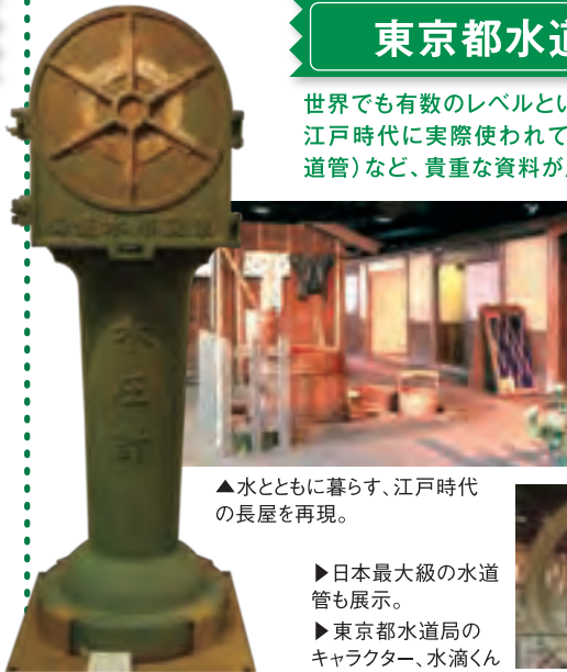
▲水とともに暮らす、江戸時代の長屋を再現。

世界でも有数のレベルといわれる東京の水道。江戸時代に実際使われていた木樋(現在の水道管)など、貴重な資料が展示されています。