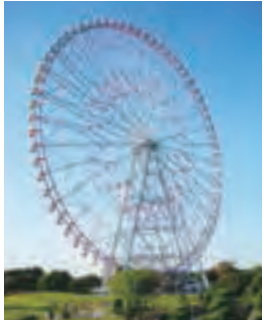
▲ダイヤと花の大観覧車で、東京を空から眺めてみよう。