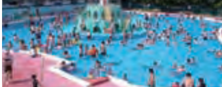
▲水深25cm~80cmの、子どもプール