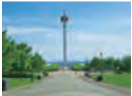
▲木々の緑も美しく、潮の香りも流れる海辺の公園です。