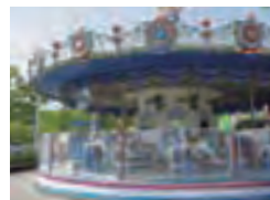
▲草競馬の音楽にのせて、1分30秒間回転します。

●開園時間:9:00~17:00(夏休み期間の日曜は雨天を除き18:00まで) ●火休園(ただし、火曜日が祝日の場合は翌日休園)、年末年始(12/29~1/1)※春・夏・冬休み期間は無休 ●入園料:土日祝春・夏・冬休み大人200円、小中学生100円、65歳以上100円/平日大人200円、小中学生無料、65歳以上100円 ※のりものには別途、のりもの券が必要です。 ●所在地:荒川区西尾久6-35-11 ☎03-3893-6003 http://www.city.arakawa.tokyo.jp/yuuen/ 【子どもプール】●開場日:7月~8月の学校の夏休み期間(気象状況などにより休場あり)●利用時間:10:00~16:00(入場は15:00まで)●料金(1日):大人(高校生以上)350円、中学生以下150円