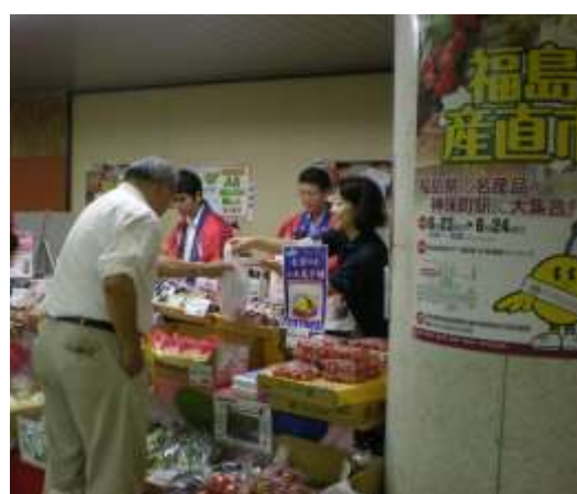
昨年の「福島産直市」の様子