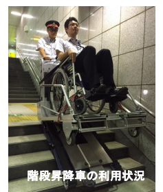
階段昇降車の利用状況