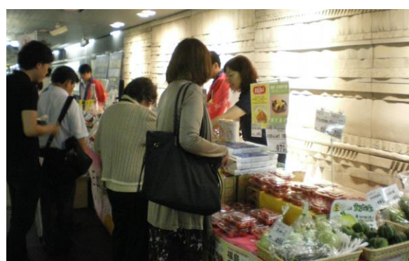
「福島産直市」の様子