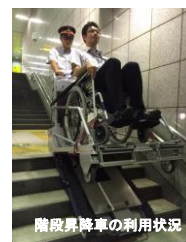
階段昇降車の利用状況