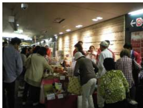
昨年の「福島産直市」の様子