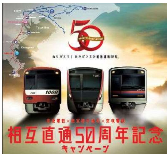
相互直通 50 周年記念ポスター