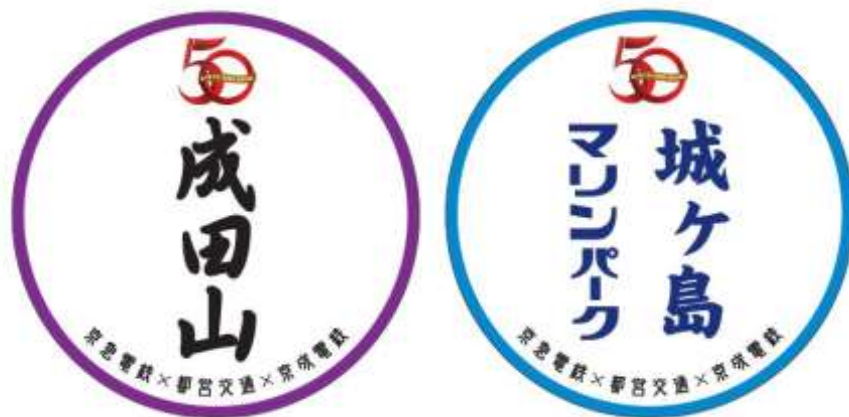
復刻運行用ヘッドマーク