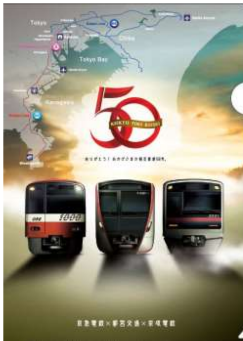
オリジナルクリアファイル