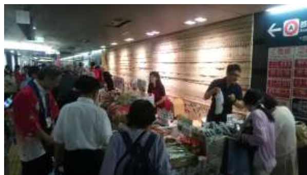
「福島産直市」の様子