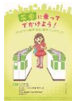
ハンドブックイメージ