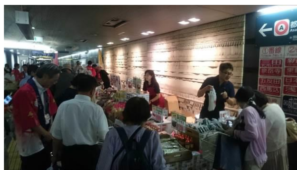
「福島産直市」の様子