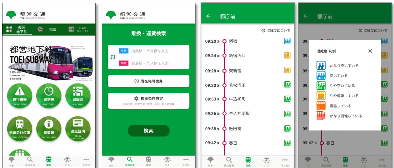
地下鉄 TOP 画面

都バス運行情報サービスへリンクし、都バスの運行状況や時刻表などを調べることができます。