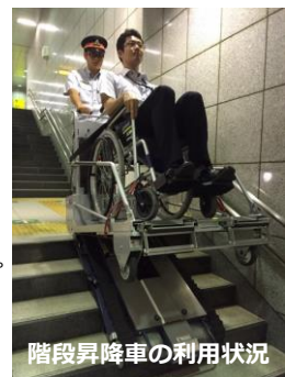
階段昇降車の利用状況