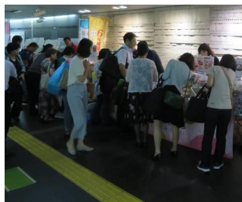
昨年の「福島産直市」の様子