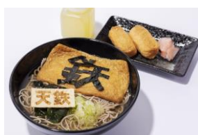
天空駅そば(イメージ)