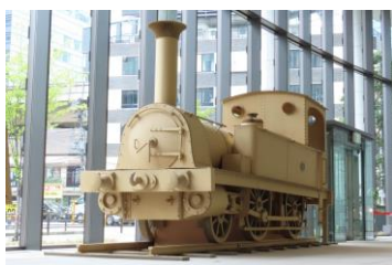
「一号機関車」(段ボール製)