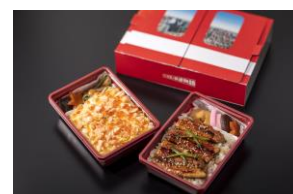
天空駅オリジナル駅弁「ドア弁」(イメージ)