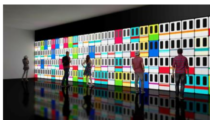
鉄道車両ドア インスタレーション (イメージ)

JR7社、東京メトロ、東京都交通局をはじめ、全国の鉄道会社の全面協力のもと、全国の鉄道系博物館でも通常は観ることができない蔵出しの展示品を軸に、国鉄時代の駅や改札の再現、歴史を振り返る空間やインスタレーション、ヘッドマークや時刻表、制服も展示し、1964年から2020年のオリンピックイヤーを結ぶ形で鉄道文化の軌跡を紹介します。日本独自の鉄道文化ゆかりの「食」「旅」「アニメーション」「ゲーム」「テクノロジー」などもフィーチャーし、鉄道ファンはもちろん、子どもから大人まで楽しめる体感型の展覧会です。