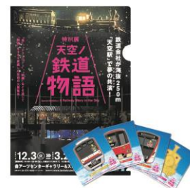
特製クリアファイルとステッカー(非売品)

賞品の引換は、達成賞、来場記念達成賞それぞれお一人様1つとさせていただきます。無くなり次第終了となります。