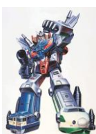
トランスフォーマー