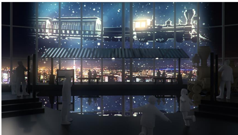
天空駅：夜(イメージ)

“食”、“テクノロジー”、“映像”などを通じて「鉄道」を360度楽しむ空前の大展覧会！