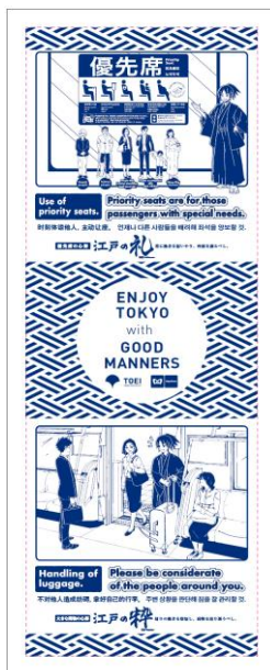
特製手ぬぐい（イメージ）