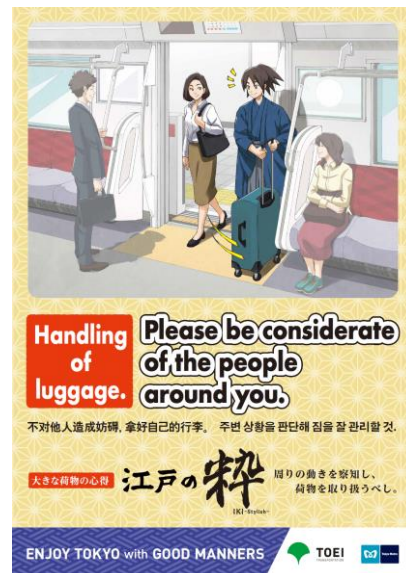
「手荷物」ポスター（イメージ）