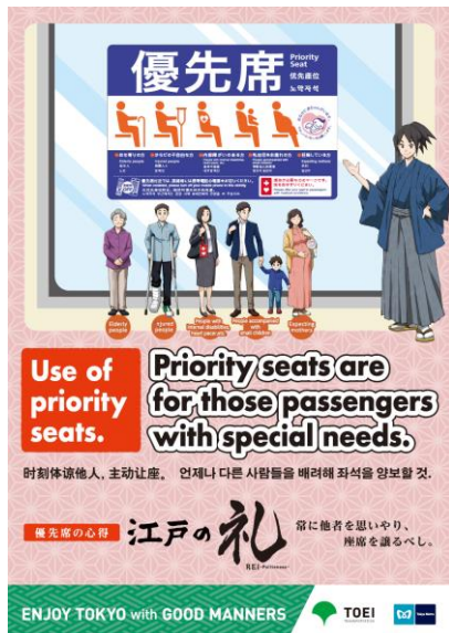
「優先席」ポスター（イメージ）