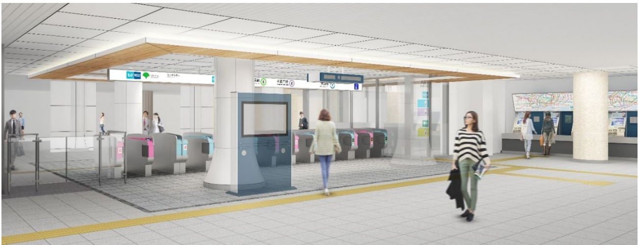
3線共通改札口イメージ（靖国神社・武道館方面改札）