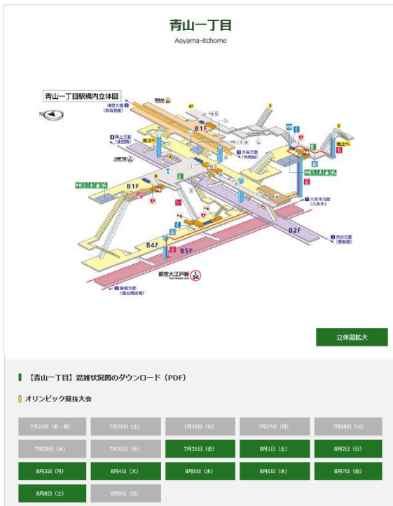
混雑予想駅 画面イメージ