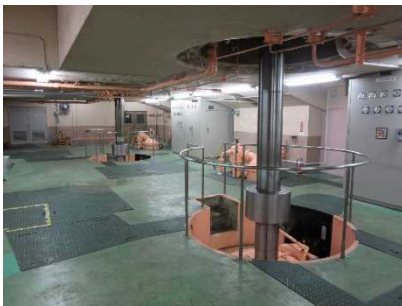
多摩川第一発電所