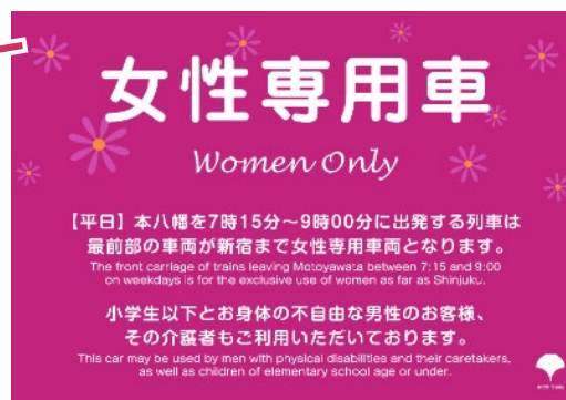
車両に貼付しているステッカー