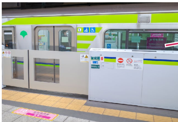
都営新宿線の女性専用車 (平成17年から導入)