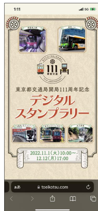
特設サイトトップ画面