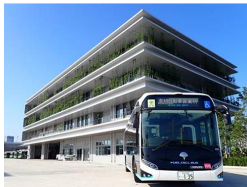
有明自動車営業所