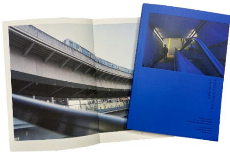
『すべての「今日」のために 都営交通写真集』【非売品】

テラダモケイ 都営交通編（都営浅草線・都営大江戸線・都営バス 3 種のうち 1 種）を贈呈