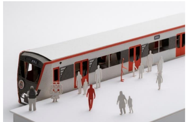
テラダモケイ 都営交通編（写真は都営浅草線）

世界的写真家集団「マグナム・フォト」の写真家 3 人（マーク・パウ ー、ゲオルギ・ピンカソフ、ハリー・グリエール）が撮り下ろした、こ にしかない東京の情景を収録した写真集です。