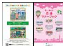
交通マナーブック ※画像は昨年度のものです。