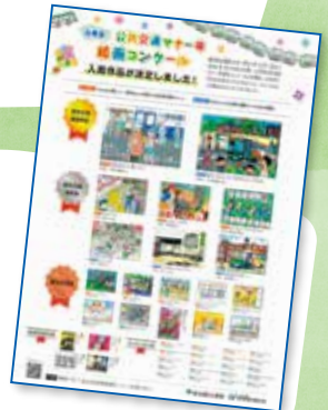
昨年度の実受賞ポスター