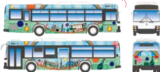
※画像は都営バス90周年のときのデザインです。