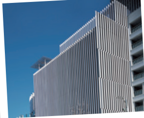
サントリー美術館 割引 大江戸線「六本木」駅