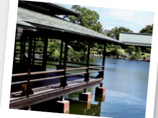
清澄庭園 入場 大江戸線「清澄白河」駅