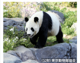
恩賜上野動物園 入場 大江戸線「上野御徒町」駅