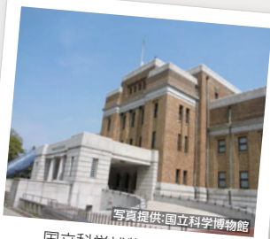
国立科学博物館 割引 大江戸線「上野御徒町」駅