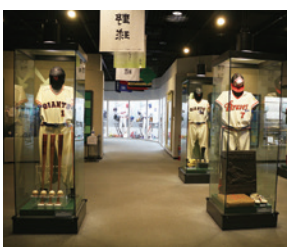
野球殿堂博物館 入場 三田線「水道橋」駅/大江戸線「春日」駅