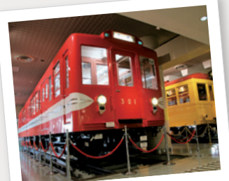
地下鉄博物館 入場 都営バス「葛西駅前」停留所