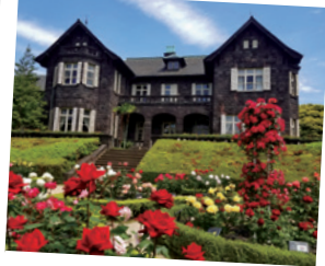
旧古河庭園 入場 都営バス「駒込駅南口」停留所