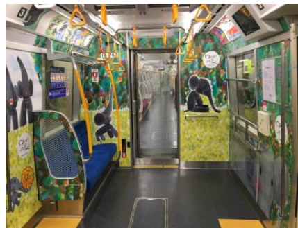
『ぐるんぱのようちえん』