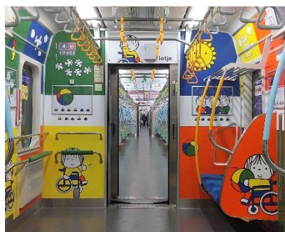
『ロツテ』 © Mercis bv