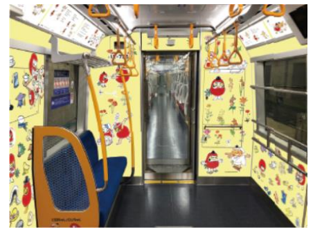
『だるまちゃん とんぐちゃん』