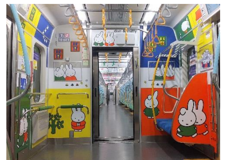
『ミッフィーとダーン』 © Mercis bv