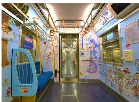
『だるまちゃんとかみなりちゃん』