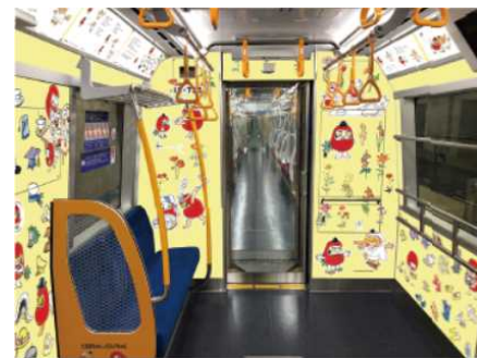
『だるまちゃん と てんぐちゃん』