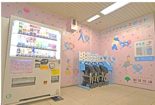
こどもスマイルスポット

自動販売機で液体ミルクや紙おむつなどの育児用品を購入できるほか、授乳室を設けており、また、ベビーカーのレンタルサービスも受けられます。さらに、これらのサービスを、親しみをもってご利用いただけるよう、壁にパンダの親子のイラストを描くなど、可愛らしく装飾しています。