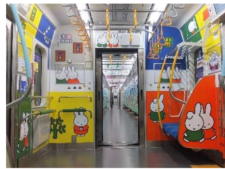
『ミッフィーとダーン』 © Mercis bv