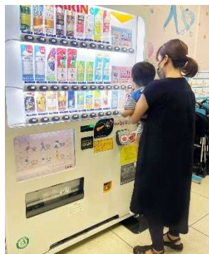
育児用品自動販売機