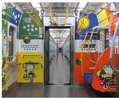
『ロツテ』 © Mercis bv