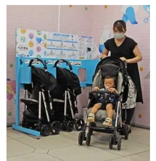
ベビーカーレンタルサービス