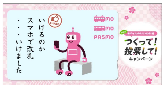
(川柳カード画像イメージ) ※本作品は前回の最優秀受賞作です