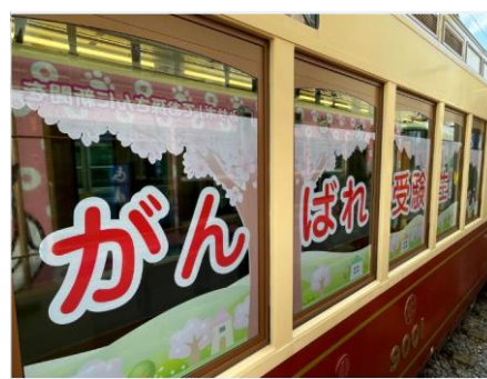
昨年(令和4年)の窓装飾