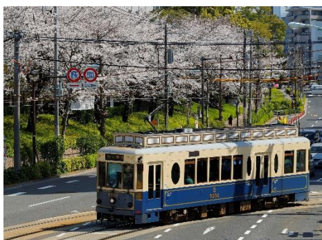
9002号車(青いレトロ車両)