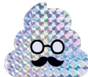
キラキラステッカー

東京都虹の下水道館でドリルを入手すると、先着で 1 万名様に「うんこ先生」のキラキラステッカーをプレゼントします。