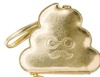
金のうんこパスケース