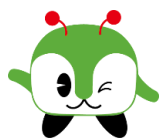
都バスマスコット「みんくる」