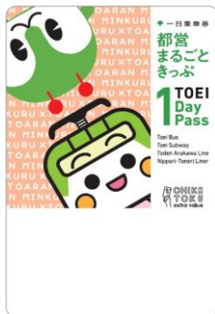
みんくる&とあらん デザイン