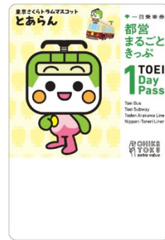
とあらん デザイン