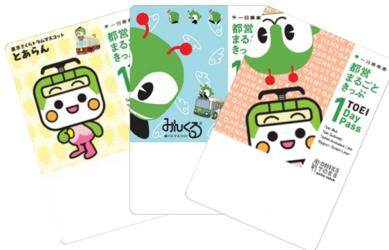
限定デザインの都営まるごときっぷ