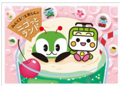
ランチョンマット