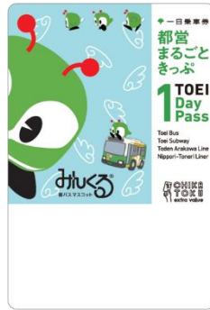
みんくる デザイン