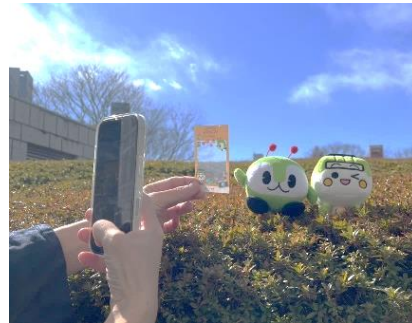
クリアカードの使用イメージ