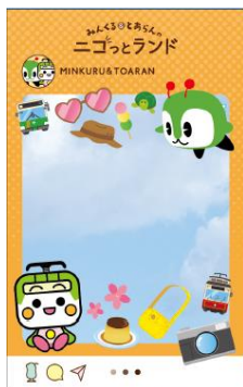
限定のクリアカード

本キャンペーンへの参加にも便利な、 限定デザインの都営まるごときっぷ を発売します。