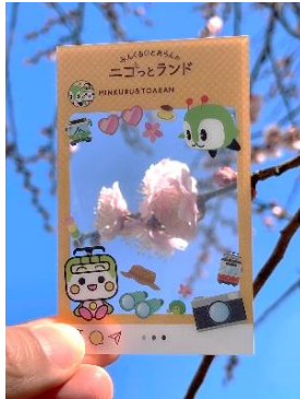
限定のクリアカード

※フотスポットに常駐しているスタッフにスタンプラリーの完了画面をご提示ください。