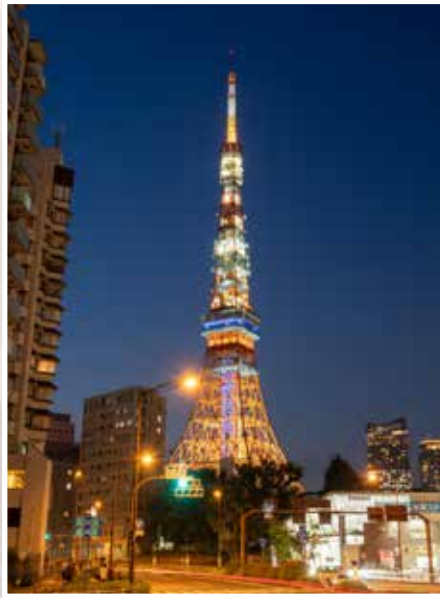
赤羽橋交差点から撮影したおなじみ「ランドマークライト」のライトアップ