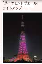
「ダイヤモンドヴェール」ライトアップ