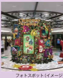
フォトスポット(イメージ)