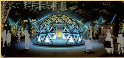
「流星のクーボラ」(イメージ)

江戸桜通りや本町通りといった歴史ある通りに、「きぼう」をテーマにした、シャンパンゴールドとホワイトブルーのイルミネーションが灯ります。「COREDO室町テラス」大屋根広場の「流星のクーボラ」は、日本上空に出現した流れ星を検知して、光で可視化する体験型のイルミネーションアートです。流れ星を見つけたときどきめきを体感できます。