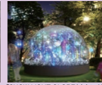
「SNOW LIGHT GLOBE」(イメージ)