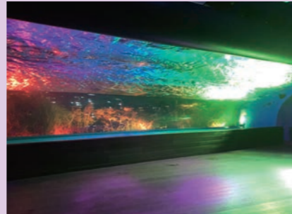
「天空のペンギン」(イメージ)

住所 豊島区東池袋3丁目1 開催期間 2020年12月25日(金)まで 点灯時間 9:30~23:00 ※施設により異なります お問合せ 03-3989-3331(サンシャインシティ総合案内)