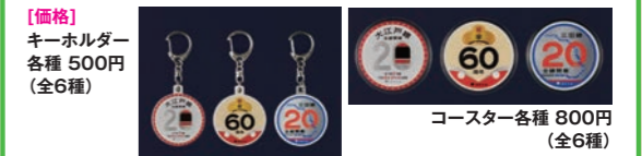
キーホルダー各種 500円(全6種) コースター各種 800円(全6種)

14時から、全商品対象の通信販売も行います! はとマルシェOnline http://www.hatomarche.com